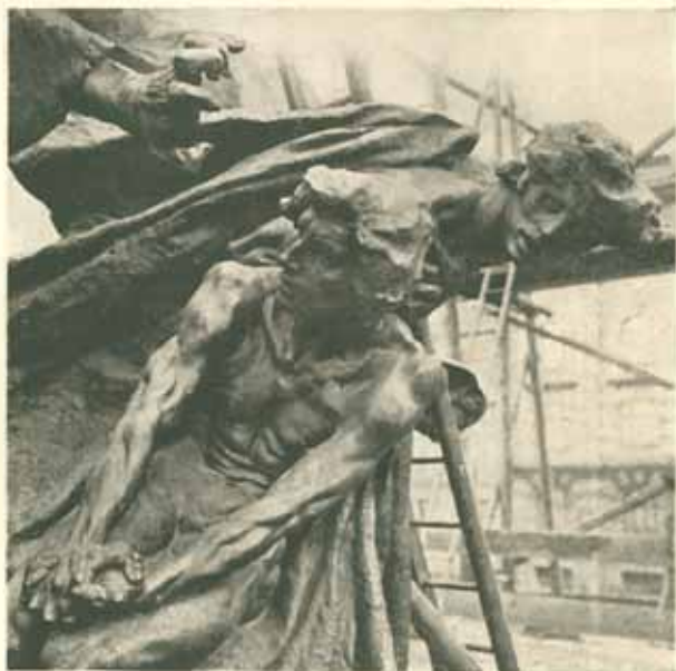
Osazování bronzové skupiny »Probuzení«. Listopad 1911.