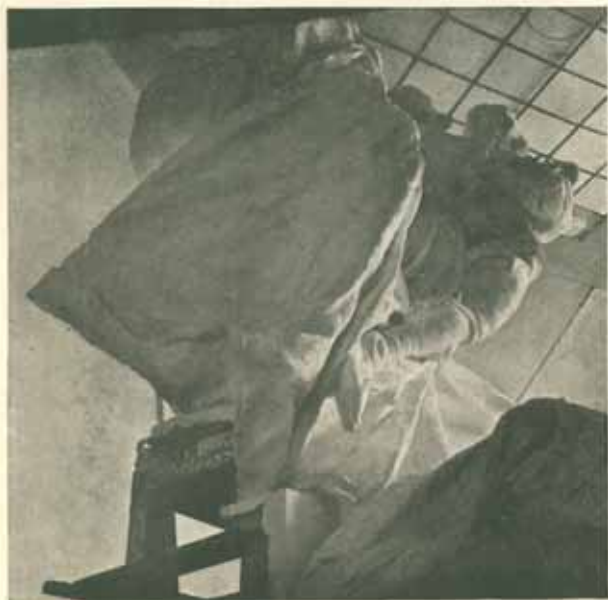
Pohled zadní na model hoření skupiny. Skutečná velikost. Listopad 1908.