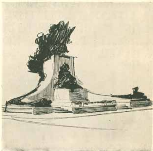
První kreslený náčrt pomníku.