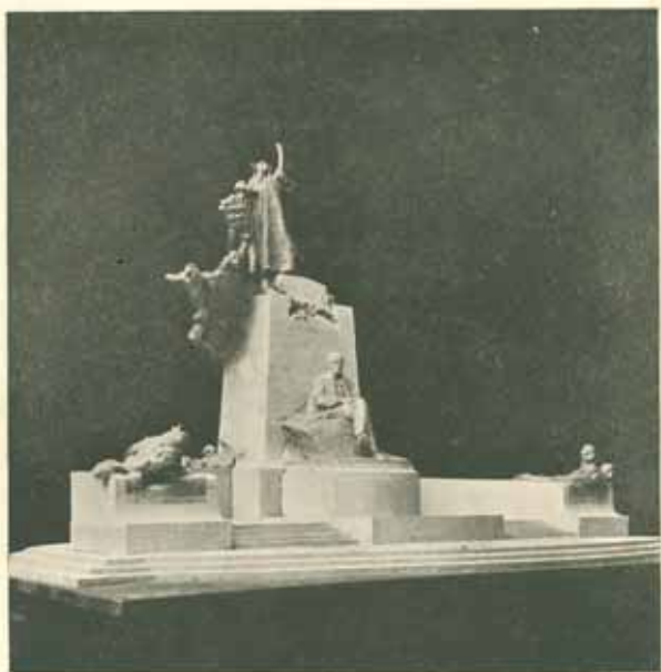
Šádrový model užší soutěže. Červen 1901.