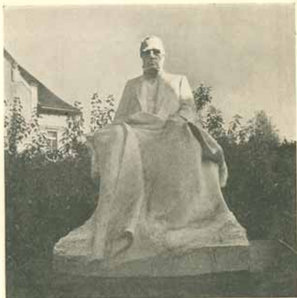
Model sochy Palackého v zahradě dílny v Bubenči. Sádra. Říjen 1910. Poloviční velikost.