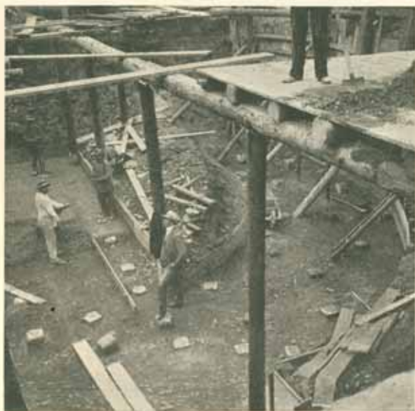
Vykopávka základu s hlavami zaberaných pilot. Červenec 1909.