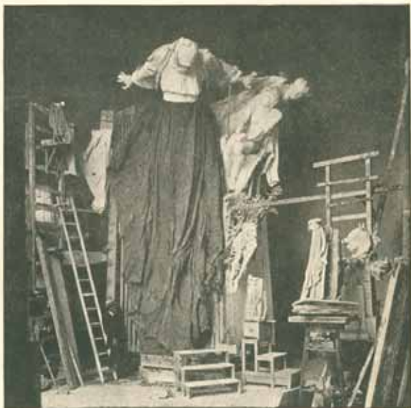
Modelování řízy »Historie« v Bubenči. Skutečná velikost. Červenec 1909.