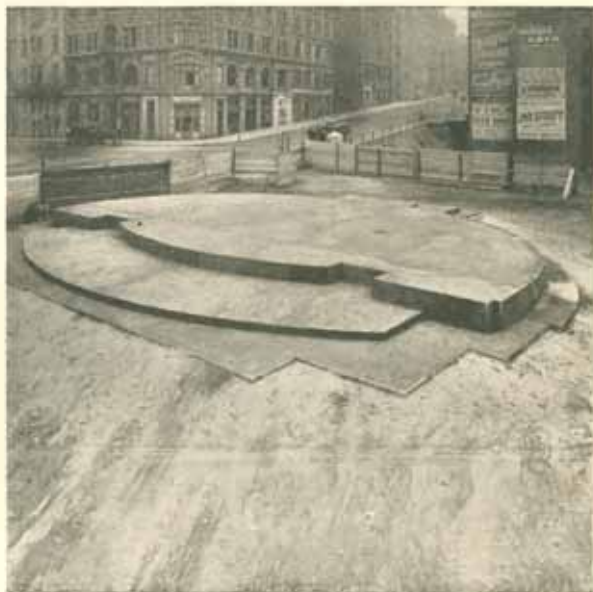
Dokončený betonový základ pomníku.