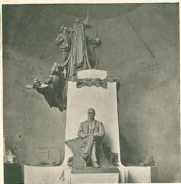
Model střední části pomníku v dílně v Bubenči. Sádra. Září 1906. Polovina skutečné velikosti.