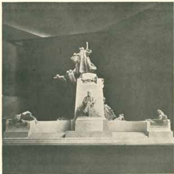
Model zadany užší soutěži. Devitina skutečné velikosti. Sádra. Červen 1901.