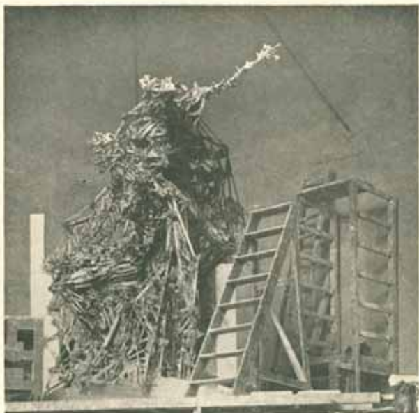
Kostra pro skupinu »Probuzenci«. Dřevo spojované sádkou. Skutečná velikost. Listopad 1908.