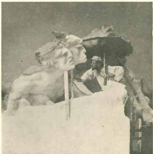
Formování skupiny »Útisk« do sádry v Bubenči. Zář 1907.