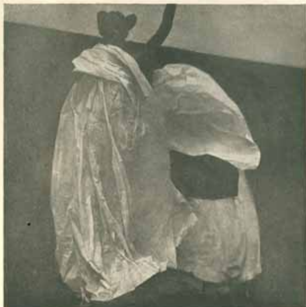
Pomůcka ku modelování draperie »Genia«. Hedbávný papír. Červen 1908. Výška modelu 30 cm.