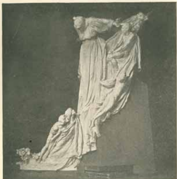
Model skupiny zadní v dílně v Bubenči. Skutečná velikost. Sádra. Leděn 1910.