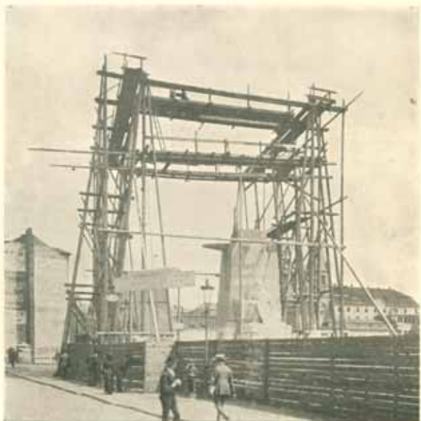
Lešení pro osazování práce bronzové.