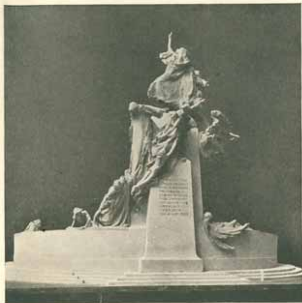
Pohled zadní na model užší soutěže. Devítina skutečné velikosti. Červen 1901. Sádra.