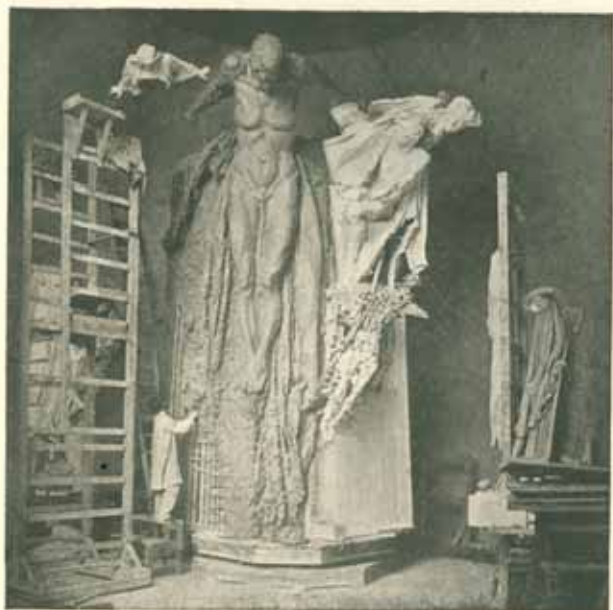
Modelování aktu »Historie« v Bubenči. Skutečná velikost. Červen 1909.