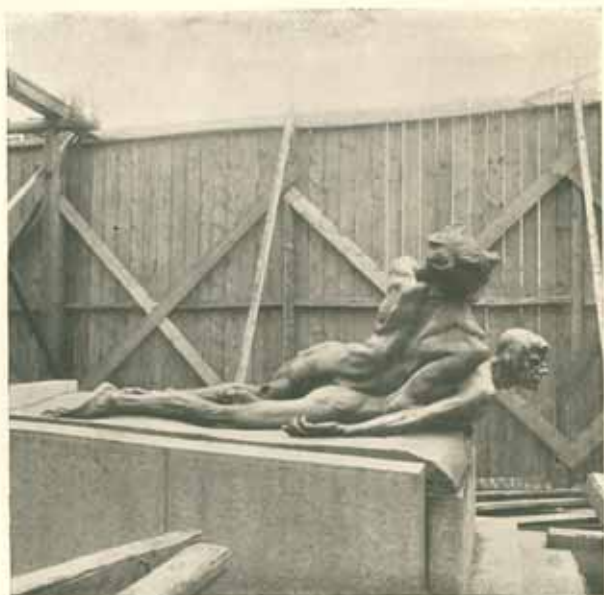
Osazování bronzové skupiny »Buditel«.