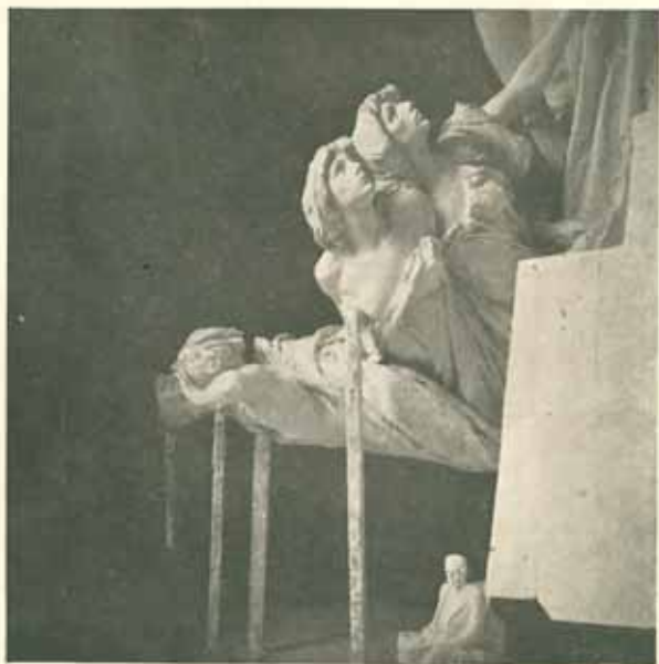
Skupina letící v dílně v Bubenči. Skutečná velikost. Sádra. Listopad 1908.