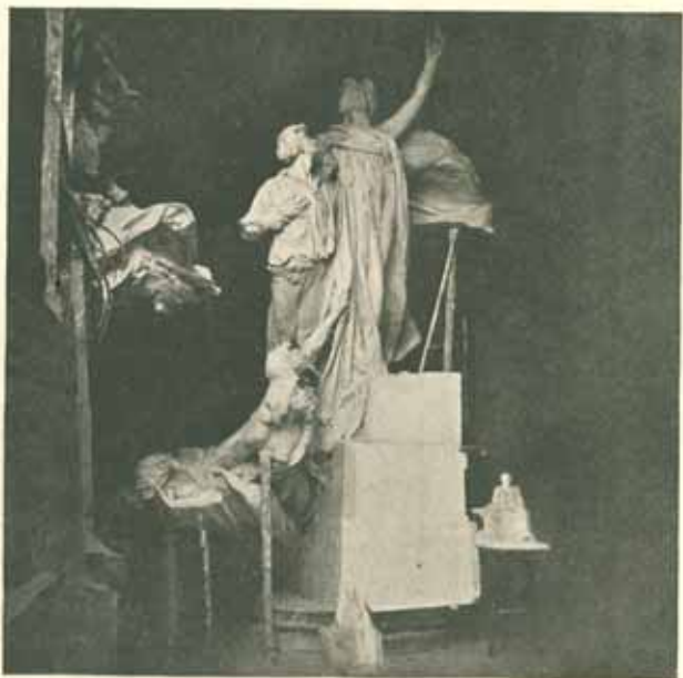
Model skupiny hoření v dílně. Skutečná velikost. Listopad 1908.