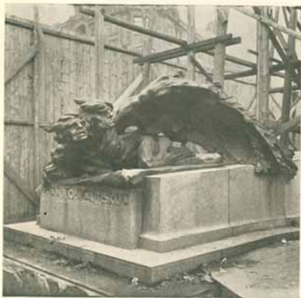
Osazení bronzové skupiny »Útisk«.