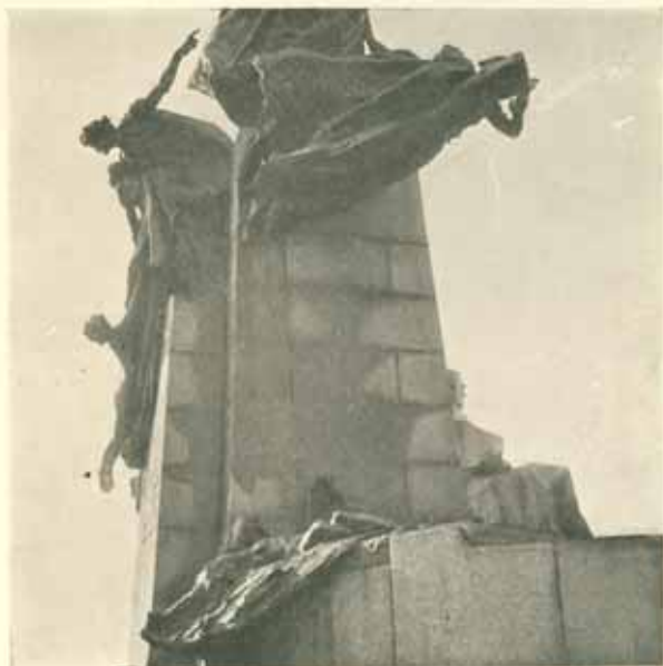
Dokončený pomník na místě.