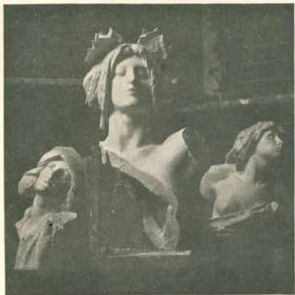
Hlavy hoření skupiny, připravené pro lití v bronzu. Sádra. Lístopad 1908. Skutečná velikost.