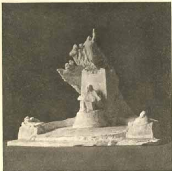
První plastická skizza. Třicetina skutečné velikosti. Sádra. 15. březen 1901.