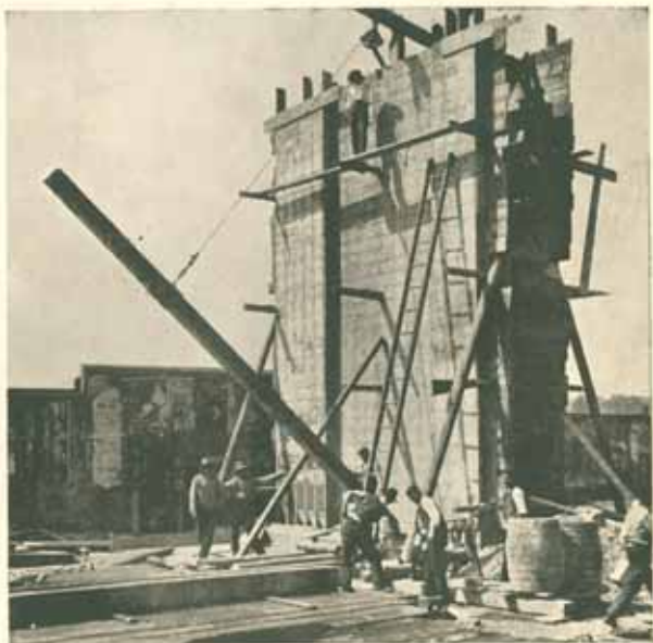
Vyjmání betonové piloty z formy na místě pomníku. Červen 1909.