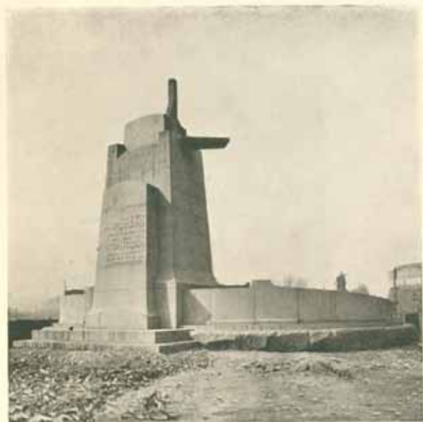
Dokončená práce kamenická ze Žuly s betonovými konsolami pro upevnění bronzu pomníku. Duben 1911.